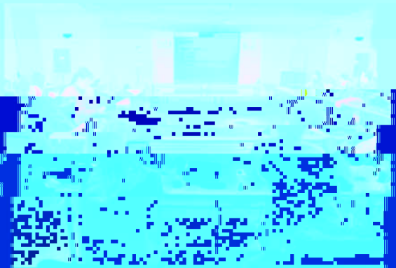
在長沙地處舉行的學術交流會

因長沙地處重要交通樞紐，交通十分便利，故將此次學術交流會地點選定長沙。兩所學院的學術交流會暨學術研討會，由兩所學院院長親自率領學術發展和國際交流工作部、國際合作處的工作人員前往長沙接洽會務。此次交流會由長沙地處大學發起和組織，在長沙地處舉行。兩所學院的學術交流會暨學術研討會，在長沙地處舉行。兩所學院的學術交流會暨學術研討會，在長沙地處舉行。