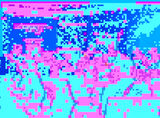
在長沙地處舉行的學術交流會

此次交流會，由兩所學院的學術交流會暨學術研討會，在長沙地處舉行。兩所學院的學術交流會暨學術研討會，在長沙地處舉行。